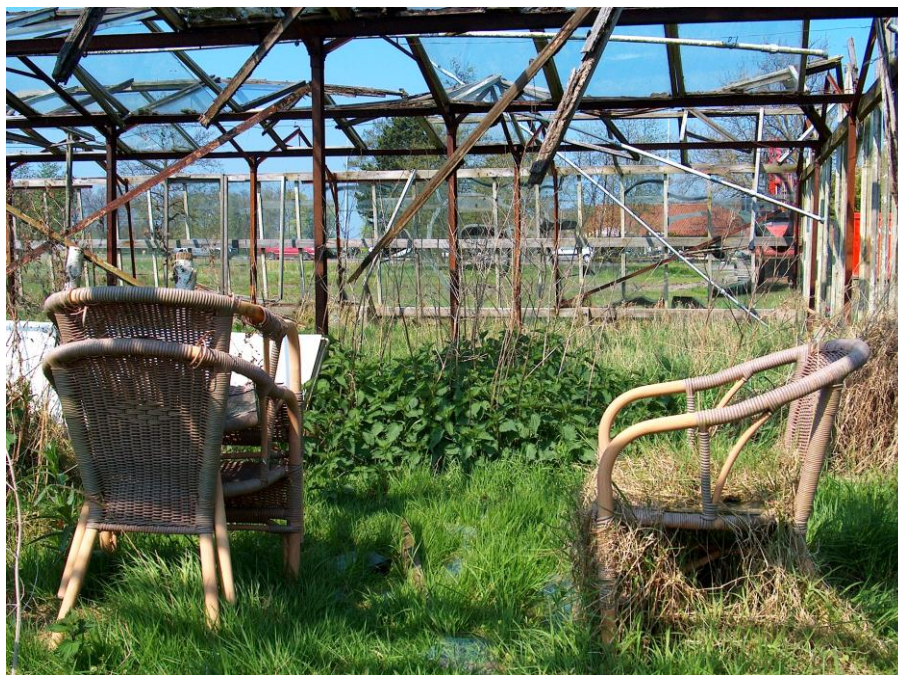
Verlaten kas in de Duivenvoordecorridor

Laat ik beginnen met een verzuchting van algemene aard. Het is zinvol om in deze periode van herijking van saneringsdoelen en koersbepaling niet alleen de kwantitatieve haalbaarheidsvraag maar ook de kwalitatieve rendementsvraag te stellen. Naar mijn mening moeten de inspanningen die de verschillende partijen zich getroosten om de sanering van verspreid liggende kassen op gang te brengen en zorgvuldig af te ronden enerzijds en de effecten die dat heeft op de samenleving en hun landschap anderzijds, met elkaar in balans zijn. Het is duidelijk dat het glassaneringsbeleid vooral is ingegeven door het zogenaamde verrommelingsvraagstuk, maar dat betekent niet dat de provincie pas tevreden mag zijn als alle ongewenste kassen uit het Zuid-Hollandse panorama zijn getouchéerd. Er is naar mijn mening niets mis met visueel waarneembare resten uit eerdere periodes van landgebruik en er is ook niets mis met agrarische ruïnes. Sterker nog, ik denk dat bewoners, gebruikers en passanten gecharmeerd kunnen worden door een oude, nutteloze kas of een afgeschreven schuur ergens in het veld. Hoed u voor smetvrees in het landschap, onafhankelijk van de beschermde status die we aan dat landschap hebben toegekend.