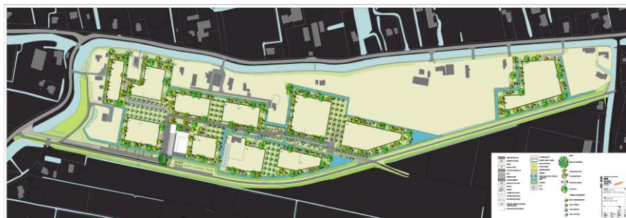
Beeldkwaliteitsplan Maaslandse Dam, 2010

In mijn rol als uw provinciaal adviseur ruimtelijke kwaliteit ben ik bij twee concrete glas-saneringprojecten die volgens het Ruimte-voor-Ruimteregime zijn georganiseerd, betrokken (geweest). Ik ben lid van het onafhankelijke kwaliteitsteam Maaslandse Dam, dat de gemeente Midden-Delfland adviseert over de wijze waarop ze het best denkbare ruimtelijke resultaat kan bereiken bij de ontwikkeling van het nieuwe buurtschap Maaslandse Dam op een voormalige glastuinbouwlocatie. Daarnaast ben ik twee keer om advies gevraagd bij de planvorming van de woningbouw die in de plaats komt van de kassen, westelijk van de kern van Oude Leede. Daarin heb ik ervaren hoe belangrijk het is dat de sanering van kassen collectief wordt georganiseerd. In beide gevallen heeft de gemeente de regie gepakt om de voorwaarden te scheppen waaronder de bouw van woningen en andere voorzieningen echt een verbetering van de landschappelijke structuur ter plaatse kan opleveren. In beide gevallen is met ruimtelijke planvorming in beeld gebracht hoe de beoogde nieuwbouw en de kwaliteit van het landschap ter plaatse op elkaar zijn afgestemd. In het geval van Maaslandse Dam is een helder, spraakmakend en vooruitstrevend ontwikkelingsprofiel opgesteld waaruit blijkt wat het gebied zal moeten gaan betekenen voor heel Midden-Delfland en op basis waarvan de verkoop en uitgifte van de kavels ter hand wordt genomen.