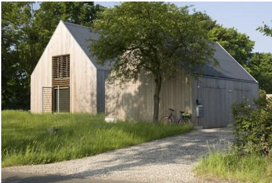
Nieuwbouw in het landelijk gebied – architect Cor Kalfsbeek